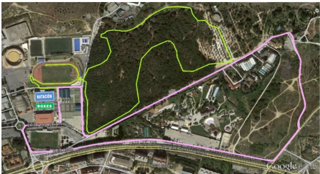
Ilustración 2: Vista aérea de recorrido del circuito de carrera

Se dispondrá de señalización vertical y horizontal con indicación de puntos de giro, vallas para la delimitación y cierre del circuito al tráfico. Se colocarán conos para dividir la calle en todo el recorrido. Se ubicarán voluntarios y efectivos de Protección Civil y Policía Local en los puntos conflictivos y desvíos. El recorrido estará cerrado al tráfico.